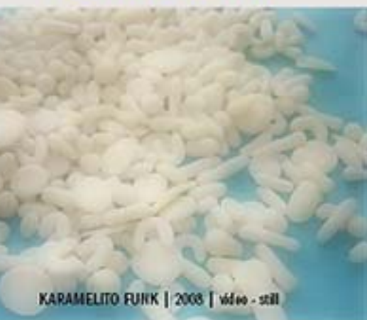
KARAMELITO FUNK | 2008 | vídeo - still