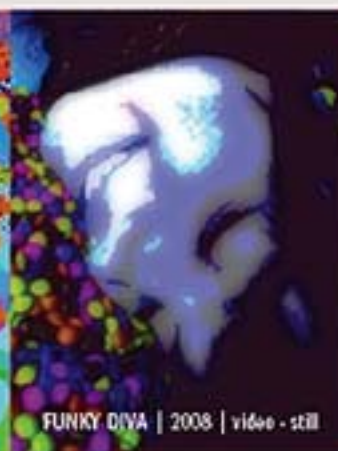
FUNKY DIVA | 2008 | vídeo - still