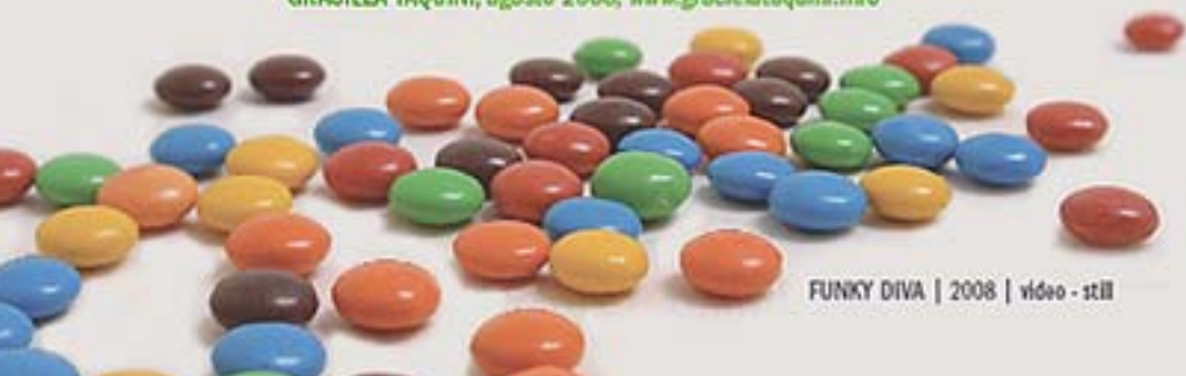
FUNKY DIVA | 2008 | vídeo - still

GRACIELA TAQUINI, agosto 2008, www.gracielaquini.info