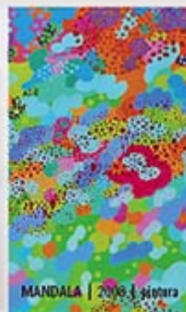
MANDALA | 2008 | guitarra